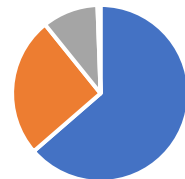
Prif Fath o Drafnidiaeth (DDd Cymru)

■ Car ■ Placement Bus ■ Public Transport ■ Other